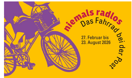
Museum für Kommunikation Berlin

Das Fahrrad steht für Mobilität für alle und für Fortschritt – und seit über 125 Jahren auch für die Post. Bereits 1896 schwingen sich Postboten auf die ersten Postfahrräder und revolutionierten damit die Zustellung. Seither ist das Fahrrad aus dem Postalltag nicht mehr wegzudenken. Unsere Ausstellung nimmt Sie mit auf eine faszinierende Reise durch die Geschichte des Postfahrrads und zeigt, wie es den Postbetrieb effizienter machte, Generationen begeisterte und bis heute ein Schlüssel zu nachhaltiger Mobilität ist.